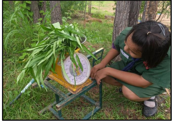
2.กิจกรรมการเลี้ยงไก่ไข่